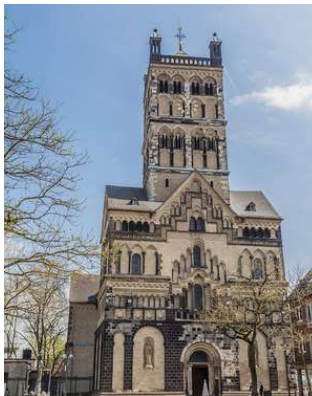
St. Quirinus