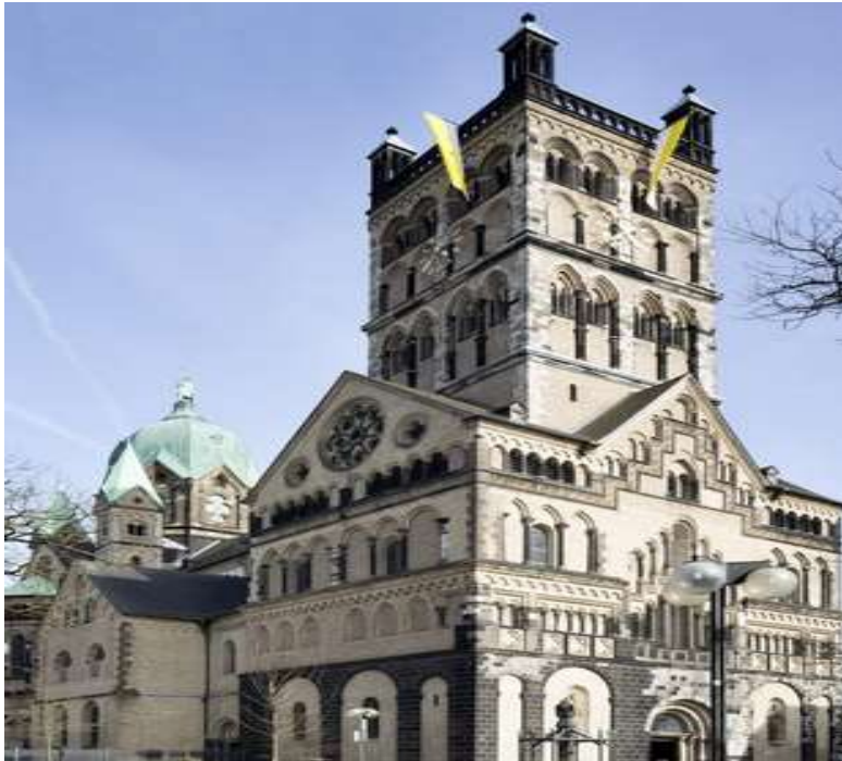
St. Quirinus-Münster Neuss